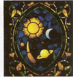
Rites traditionnels (GOA)