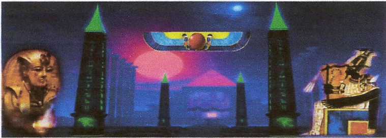
Rite Egyptien Voie Orientale